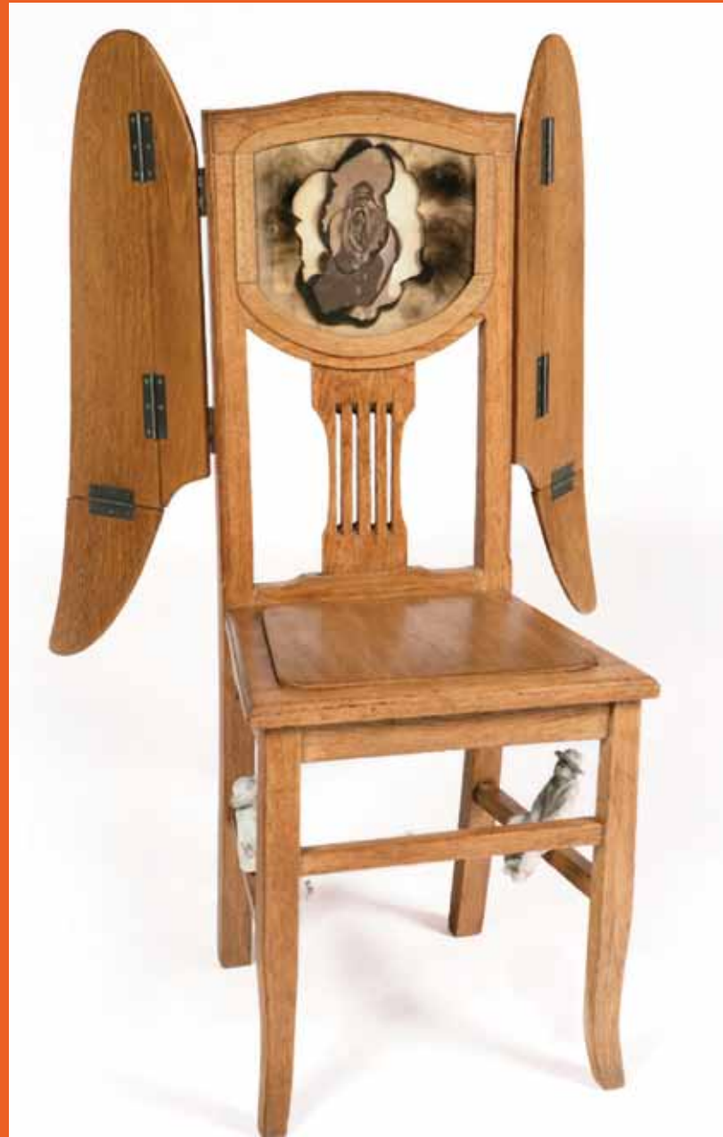
LAS RUINAS CIRCULARES silla de madera y papel - heliografía 2008 THE CIRCULAR RUINS wooden chair - paper - heliography