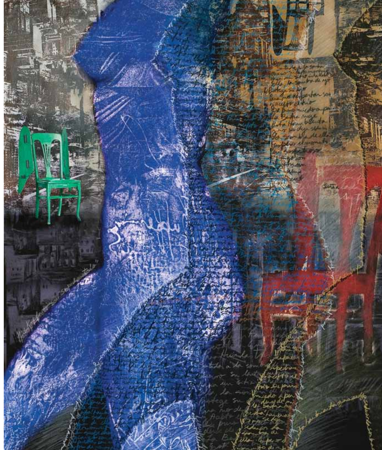
SOSPECHOSO TRIO / giclée y lápiz color / 84 x 70 cm. / 2011 A SUSPICIOUS TRIO / giclée and color pencil