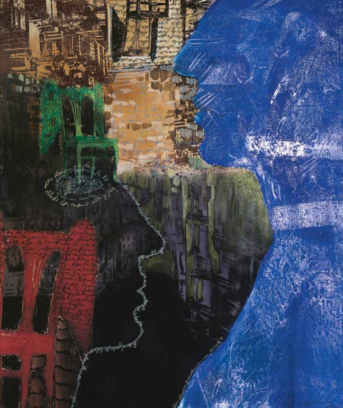
DOS DESCONOCIDAS CON UN SECRETO / giclée y lápiz color / 84 x 70 cm. / 2011 TWO UNKNOWN WOMEN WITH A SECRET / giclée and color pencil