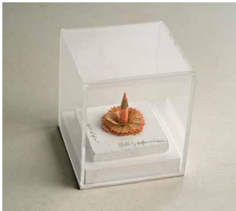
DEL FIN AL PRINCIPIO / Caja - lápiz de madera / 12 x 10 x 10 cm. / 2011 FROM END TO BEGINNING / Box - wooden pencil