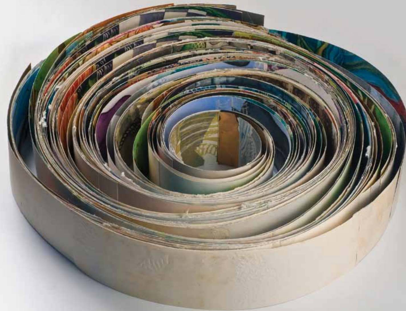
TESTIMONIO Instalación - rollo de papel grabado al aguafuerte 45x 40 x 40 cm. / 2009 TESTIMONY Installation - etched rolled paper