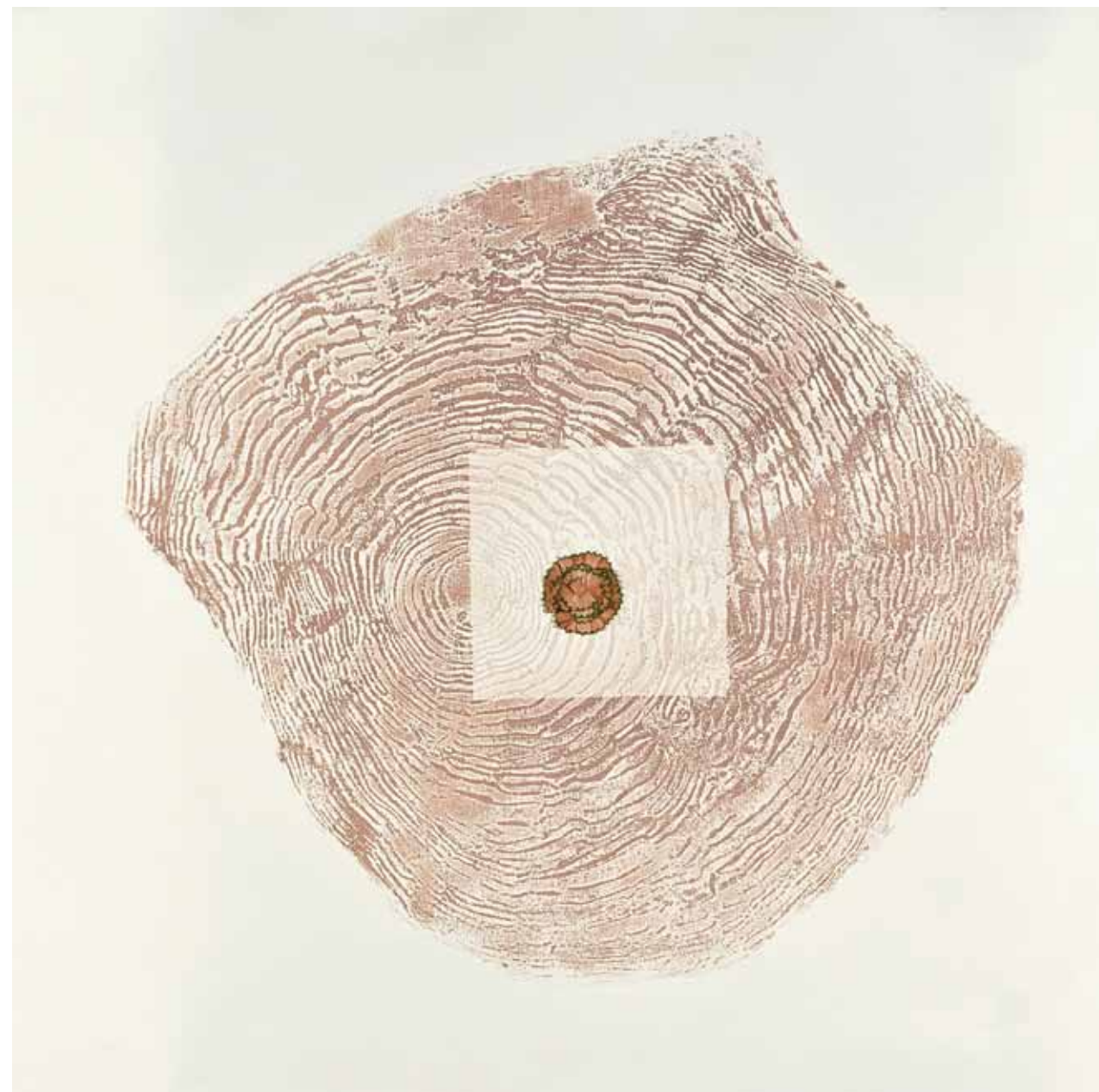
DEL PRINCIPIO AL FIN / aguafuerte y viruta de lápiz / 78 x 78 cm. / 2011 FROM BEGINNING TO END / etching and pencil shavings