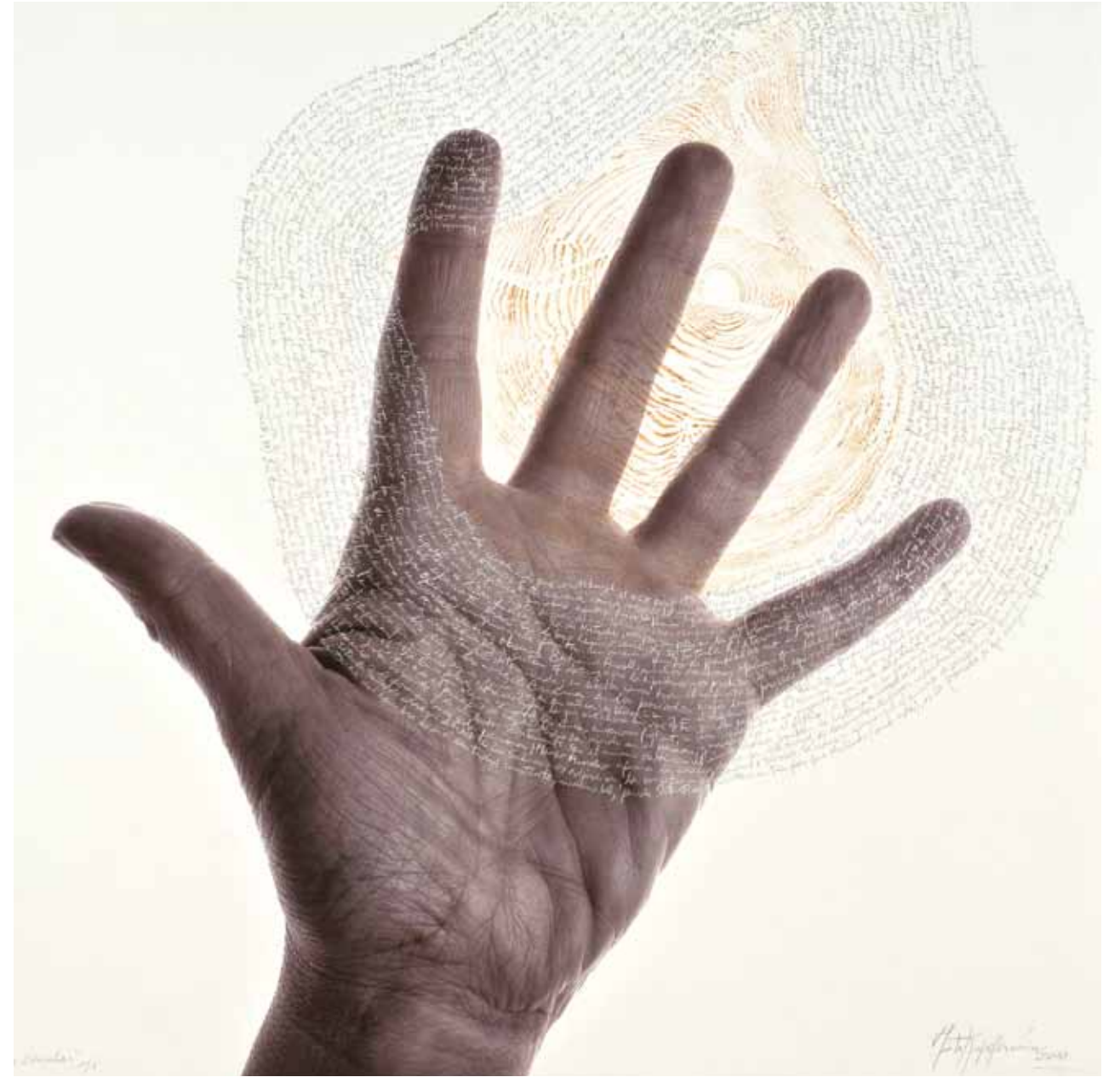
EL TIEMPO CIRCULAR / Giclee - xilografía - lápiz / 84 x 91 cm. / 2010 CIRCULAR TIME / Giclee - xilography - pencil