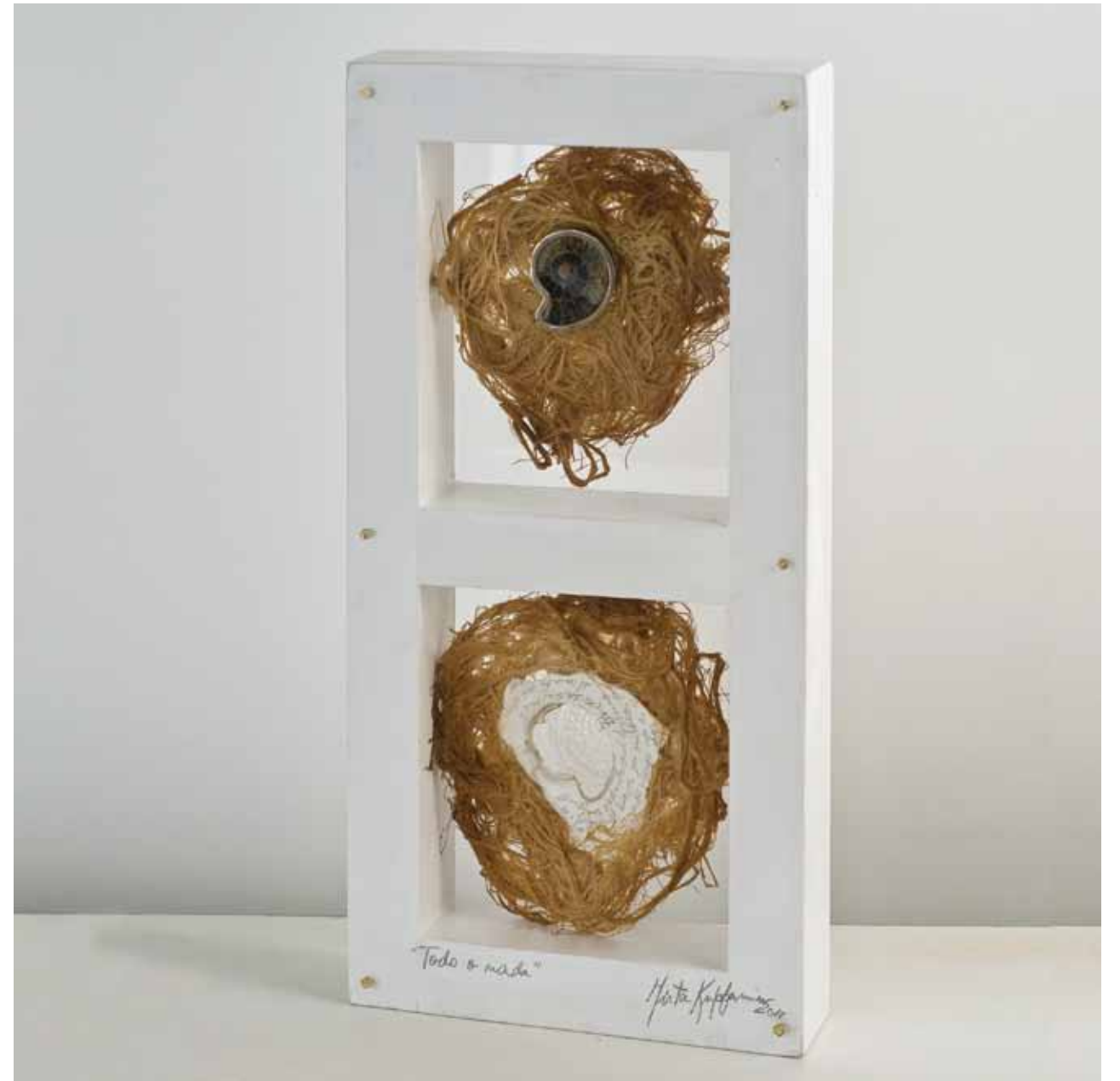
O TODO O NADA / Objeto escultórico - técnica mixta / 40 x 20 x 5.5 cm. / 2011 ALL OR NOTHING / Sculptural object