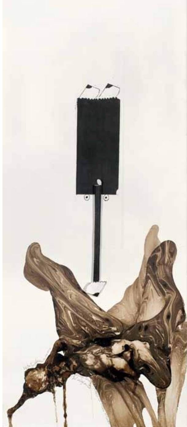
EL ELEFANTE / técnica mixta / 72 x 30.5 cm. / 2010 THE ELEPHANT / mixed media