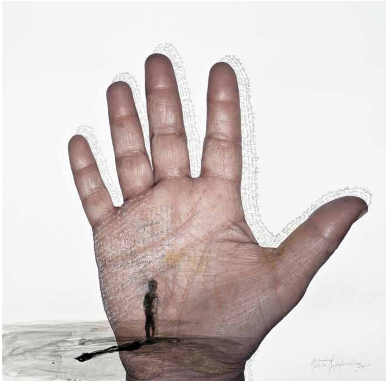
PARA HUIR LAS TRES / giclée, tinta y lápiz / 84 x 90 cm. / 2011 FOR ALL THREE TO / giclée, ink and pencil