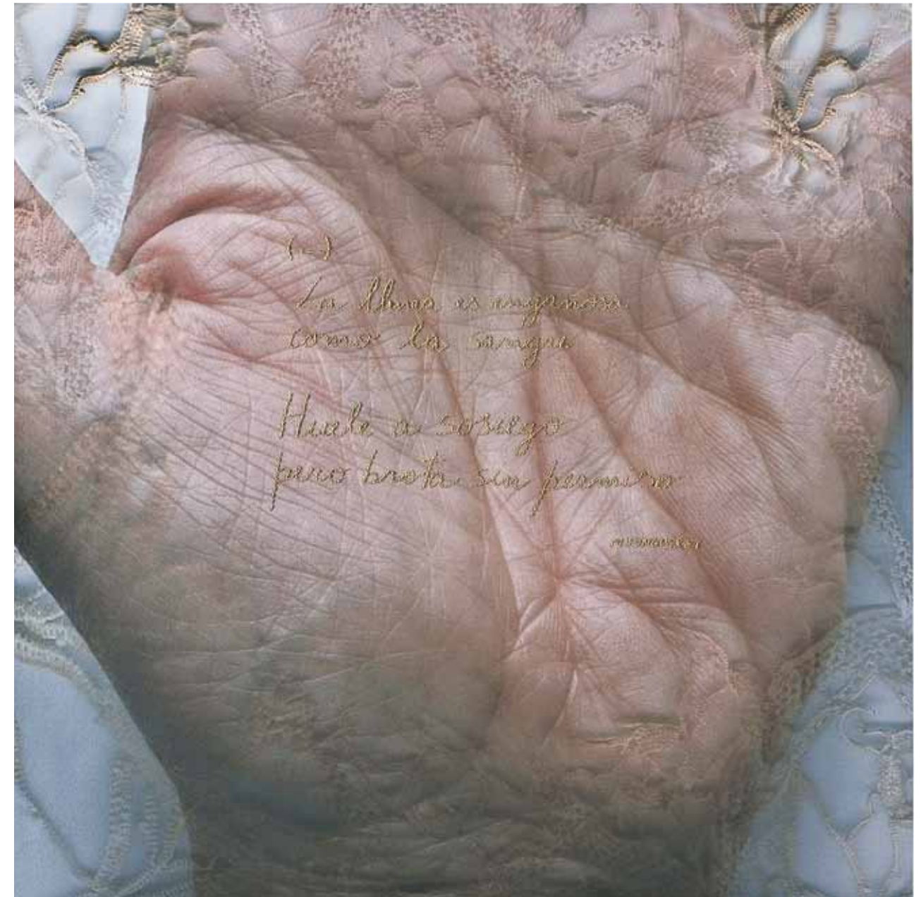
A PARTIR DE UNA AGUJA / giclée y bordado / 60 x 60 cm. / 2011 IT BEGAN WITH A NEEDLE / giclée and embroidery