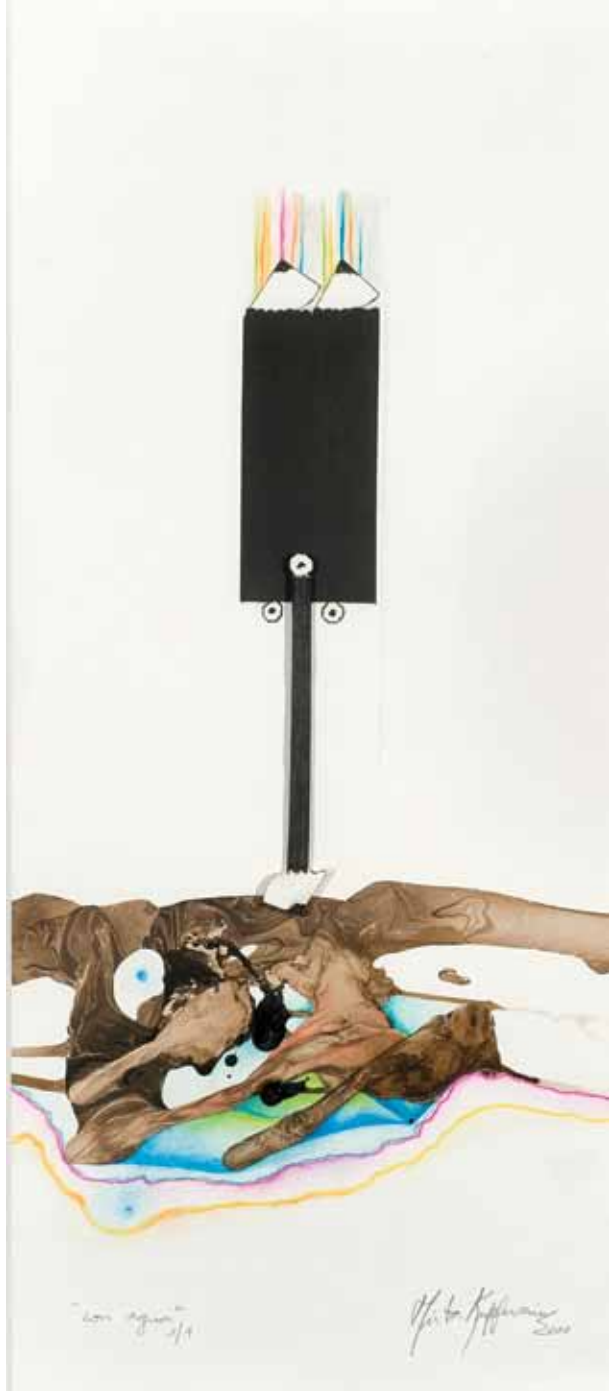
MUJER DERRAMADA / técnica mixta / 75.5 x 32 cm. / 2011 SPILT WOMAN / mixed media