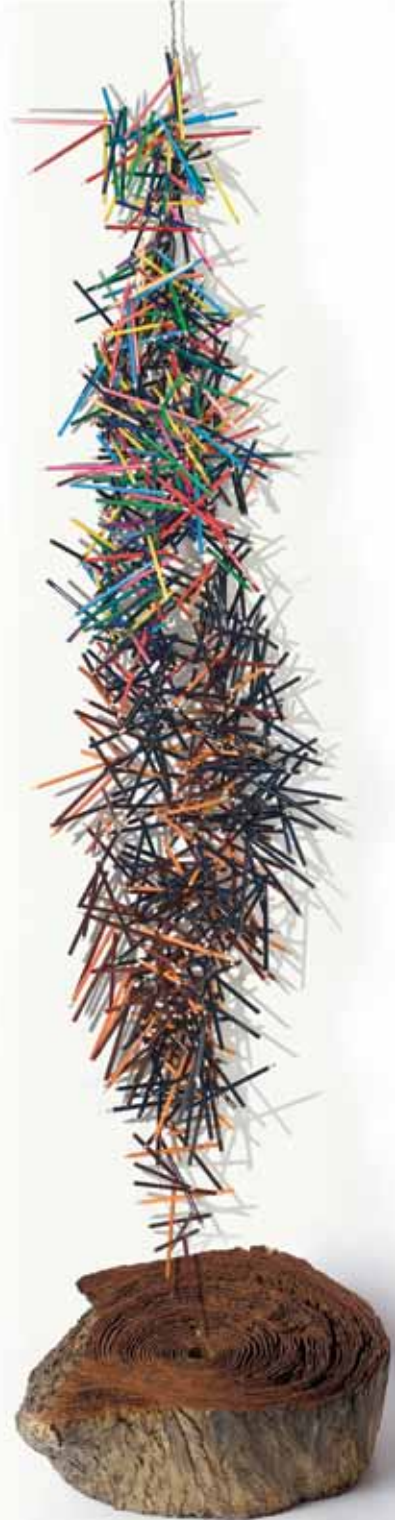
LA MARCA DE MUCHOS INVIERNOS 1 Instalación - lápices y tronco de madera 220 x 60 x 60 cm. / 2011 OF MANY WINTERS THE IMPRINT 1 Installation - pencils and tree trunk