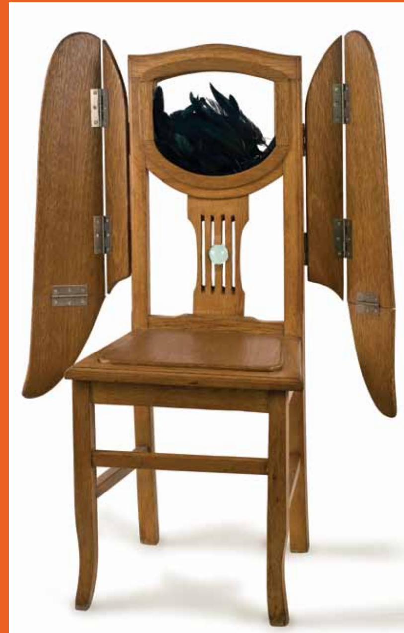
PARA PODER VOLAR Silla de madera - plumas 2010 IN ORDER TO FLY Wooden chair - feathers