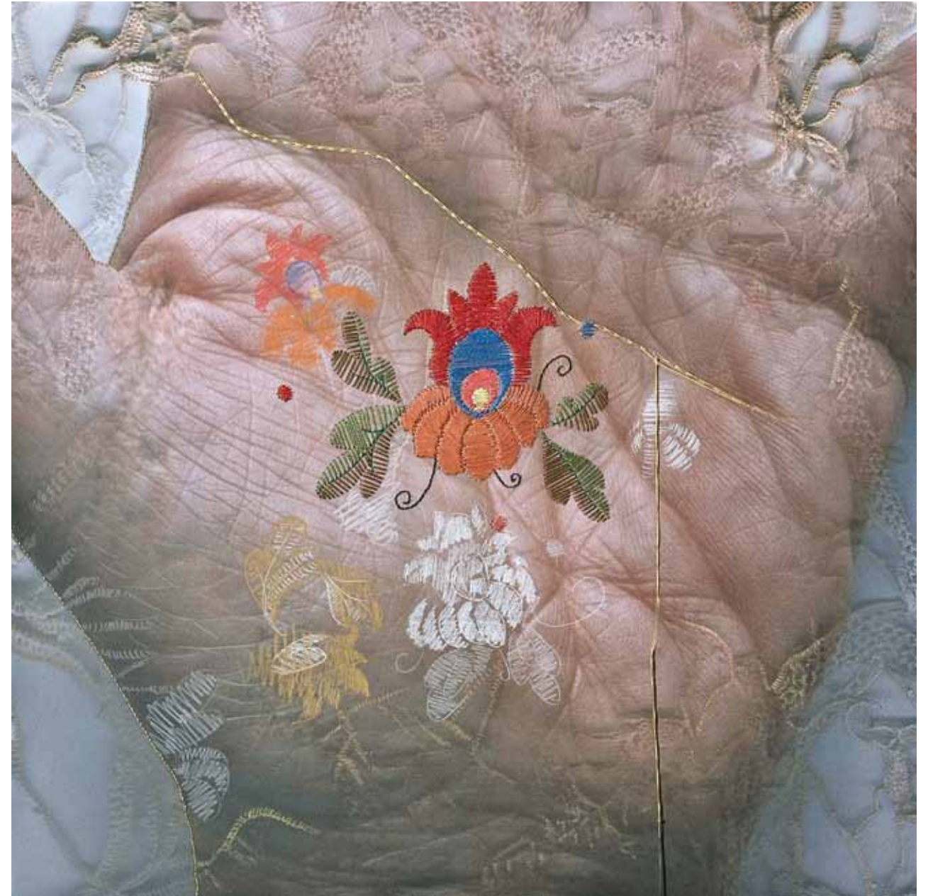
PASO A PASO, PUNTADA A PUNTADA / giclée, bordado y lápiz color / 60 x 60 cm. / 2011 ONE STEP AT A TIME, ONE STITCH AT A TIME / giclée, embroidery and color pencil

Acepto el reto y miro desde el tren imagen que avanza cuando arribo a Auschwitz y aguardo señal: derecha o izquierda para tatuar destino